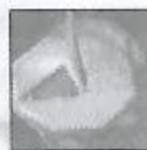
Mine niveau 1

La seconde représente l'arme lourde sélectionnée et le nombre de munitions de celle-ci.